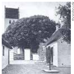
Ældre fotografi med den gamle rytterskole til højre.

Vi er meget tilfredse med resultatet af ombygningen, som er blevet udført af lokale håndværkere. Det er første etape, som står færdig