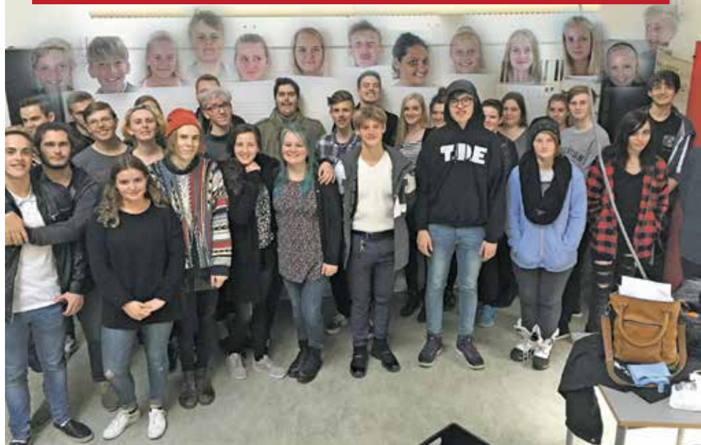
Næstved Gymnasiums musikhold og årets konfirmander.

firmander. Ved denne aftengudstjeneste vil unge mennesker fra årets konfirmandhold og gymnasieelever fra Næstved illustrere centrale trosspørgsmål gennem forskellige musikalske optrin. De vil ved at arbejde med forskellige musikgenrer og tekster fra forskellige tider vise, hvordan troen på Gud kan have en mangfoldighed af udtryk. Vel mødt til en aftengudstjeneste skabt af unge mennesker fra egnen.